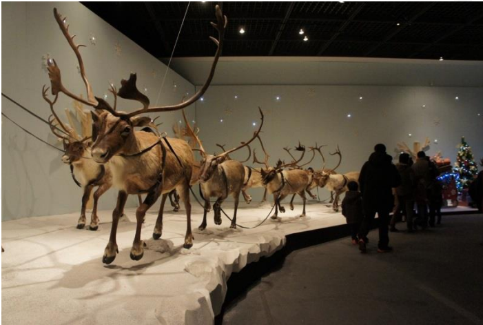
Sled of the Santa Claus - Seoul 2012/2013