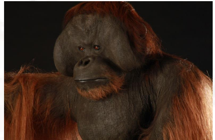
Natural history museum of Jeongok - 2011