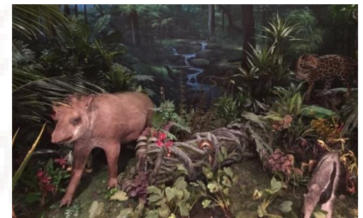
Shanghai Science and Technology Museum - 2013 & 2014