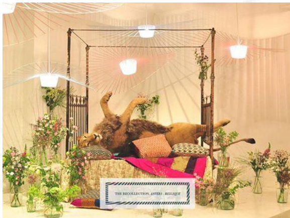
The Recollection – Antwerp 2015