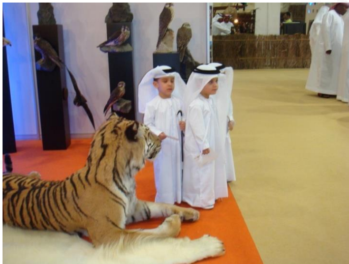
Fair Adihex Abu Dhabi 2009