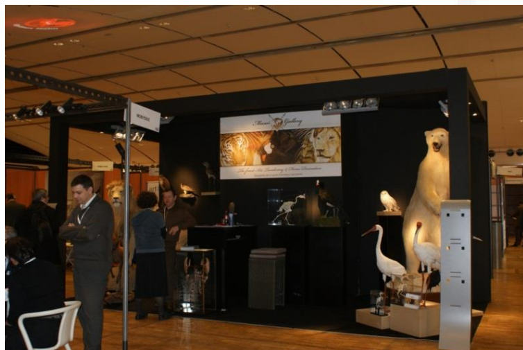
Carrousel du Louvres 2010