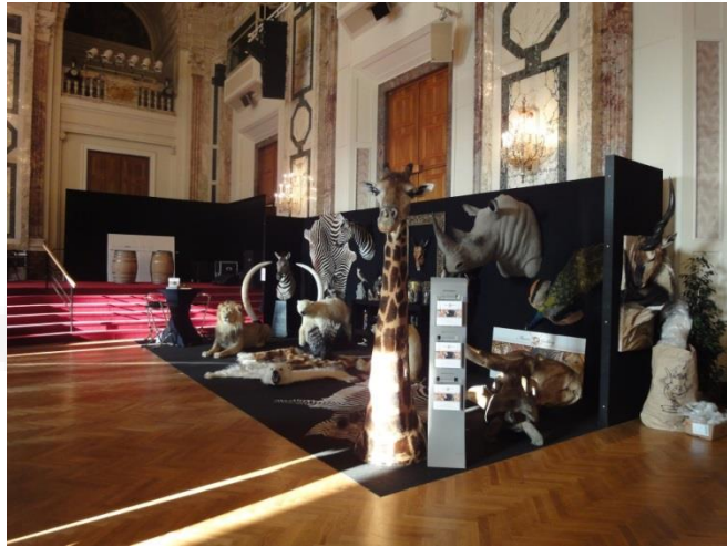
Vienna 2011 Austria