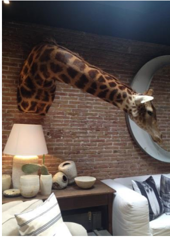
Azul Tierra – Barcelona 2014 & 2015