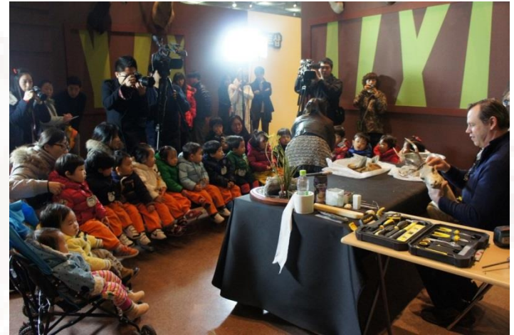
Demonstration of taxidermy - Seoul 2012/2013