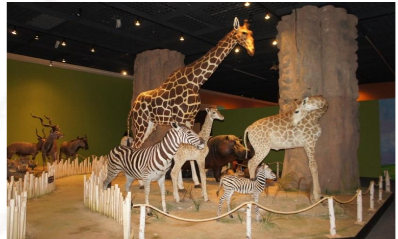
Animals from the 5 continents – War Memorial of Seoul 2012-2013 Delivery of more than 200 specimens