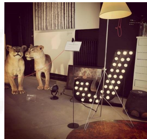
The Wauw-shop - Courtrai 2015